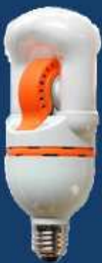
Vénus 15 W

Véritable révolution technologique par la miniaturisation, la série Vénus a été conçue pour remplacer simplement les sources à culot. Disponibles en E27 et E40, elles s'adaptent dans la plupart des luminaires.