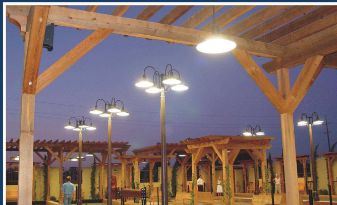
Réalisation Vénus 40 W