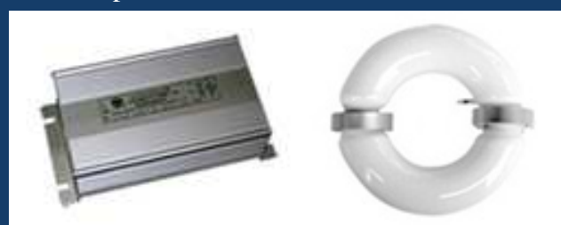
Lampe Saturne et Ballast